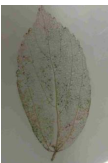
葉脈だけになった葉っぱを乾かして、ラミネートすると・・・