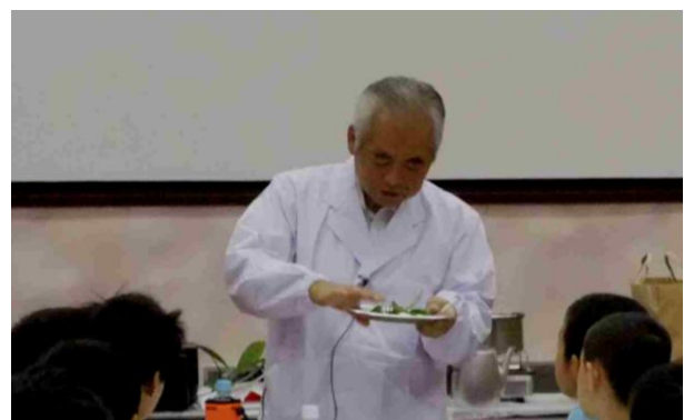
どうやったらうまくとれるかな～。