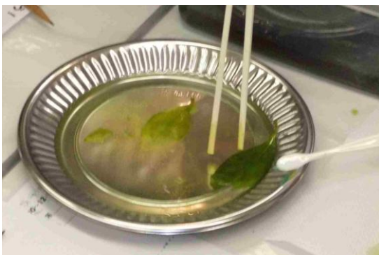
歯ブラシを使ってやさしくたたきます。