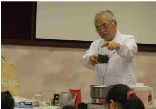
葉っぱを煮出して柔らかくしたものです。