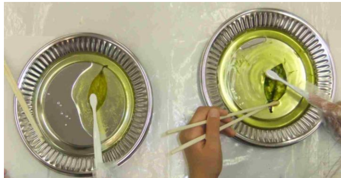
少しずつ葉っぱがはがれてきました。