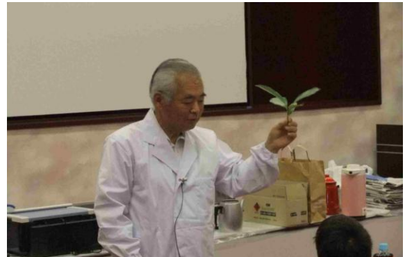
厚みのある葉っぱは葉脈がとりにやすいです。