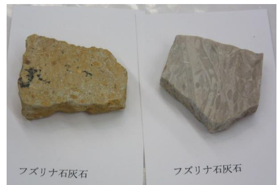
ルーペやけんび鏡を使って化石を観察します。 いろいろな化石を見ることができました。 台紙に貼って完成です。