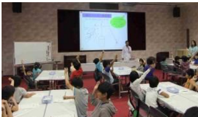
皆さん、静電気を感じたことはありますか？