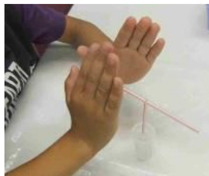
ストローをティッシュでこすると静電気が発生します。ストローにいろいろな物を近づけると、付いたり離れたりします。