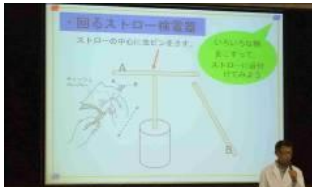
実際に静電気を起こしてみましよう。