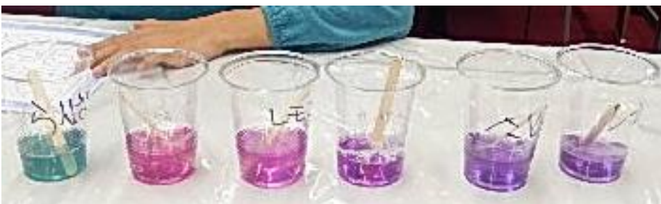
色が変わり、さん性、中性、アルカリ性なのかが分かりました。