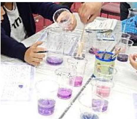
レモン汁、さとう水、せっけん水などに紫キャベツ液やハーブティーをいれて観察します。