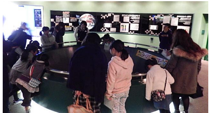
下をのぞいてみると・・・何が見えるかな。