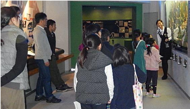
テライトの案内で展示ホールを見学しました。