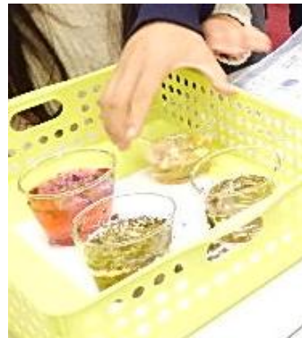
ハーブティーは色も香りもたくさん種類があります。