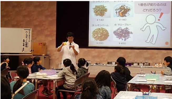
今日の実験につかう七変化するハーブティーはどれかな？