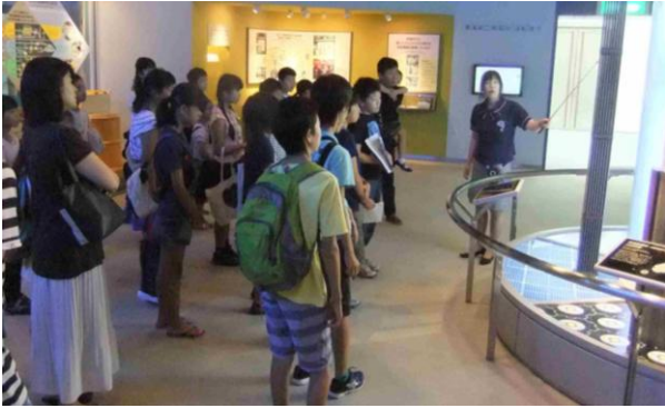
テラメイトの案内で展示ホールを見学しました。