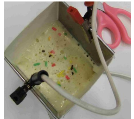
徐々に膨らんできました。