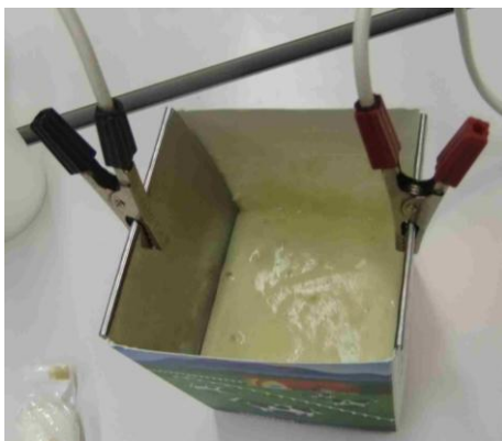
わに口クリップを挟んで電気を入れます。