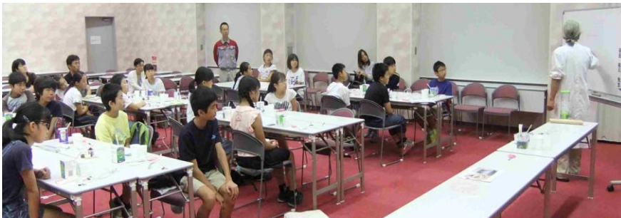
どうして電気を通すと熱がでるのかな？ なぜパンが焼けるのかな？