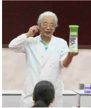
夏休みの研究や工作のヒントになるお話を聞きました。