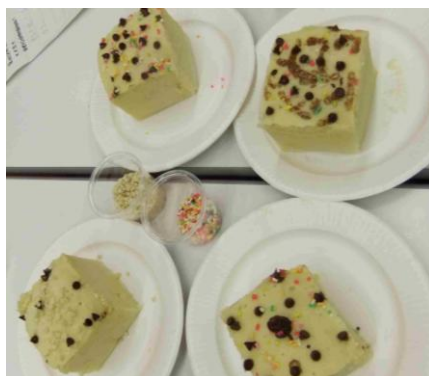
好きな物をトッピングしました。