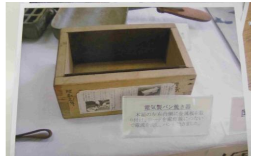
昔のパンは木型を使って作っていました。