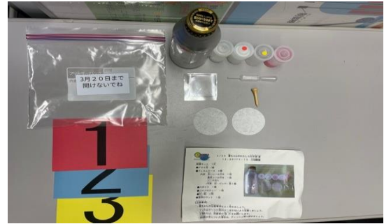
今回の実験キット。