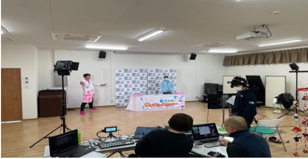
はじめてのWEB 配信・・・スタッフも緊張 (撮影の裏側)